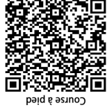
Course à pied